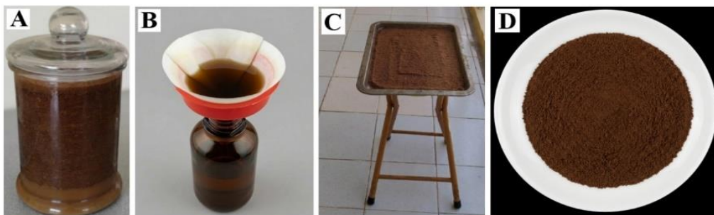
Hình 1. Xử lý phụ phẩm sau khi chiết xuất tinh dầu quế

Vỏ quế ( Cinnamomum cassia ) được thu mua từ công ty dược liệu An Bình (Nghĩa Trai, Hải Phòng) và được định danh thông qua so sánh với các tiêu bản đại thể và vi thể của mẫu chuẩn được lưu tại phòng thí nghiệm Dược liệu, Khoa thú y, Học viện Nông nghiệp Việt Nam. Vỏ quế được nghiền nhỏ và ngâm với nước cất theo tỷ lệ 1:50 (mỗi 100g quế ngâm với 5l nước) rồi chiết lấy tinh dầu theo phương pháp cất kéo hơi nước trong 6 giờ, sử dụng bộ chưng cất tinh dầu nhẹ Clevenger (Nguyễn Thanh Hải và ctv, 2023). Tinh dầu sau đó được thu riêng để sử dụng (Nguyễn Thanh Hải và ctv, 2023), còn nước chung và bã thì dồn vào các bình thủy tinh, để yên trong 3-4 tiếng để nước nguội và bã quế lắng xuống (Hình 1A). Sau đó hỗn hợp này được lọc qua giấy lọc để tách riêng nước chung và bã (Hình 1B). Phần bã tiếp tục được phơi trong bóng râm cho đến khi khô bột nước (Hình 1C) rồi đem sấy ở nhiệt độ 50°C trong 72 giờ và nghiền thành bột mịn dùng cho mục đích tái sử dụng (Hình 1D).